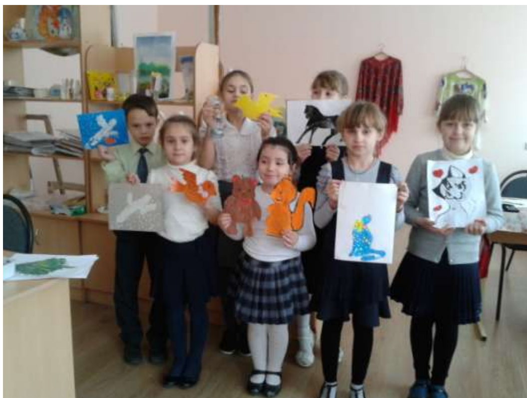
Воспитанники арт-студии «Уютный дом»