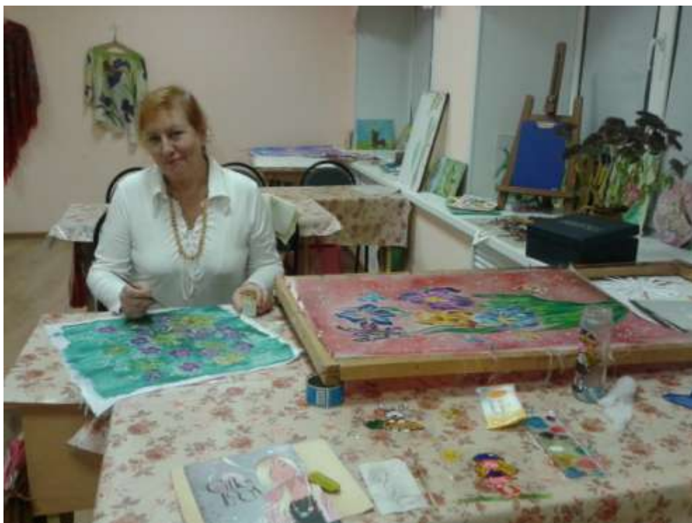
В студии «Уютный дом» занимаются не только учащиеся школы, но и жители микрорайона (в рамках проекта ОАШ)